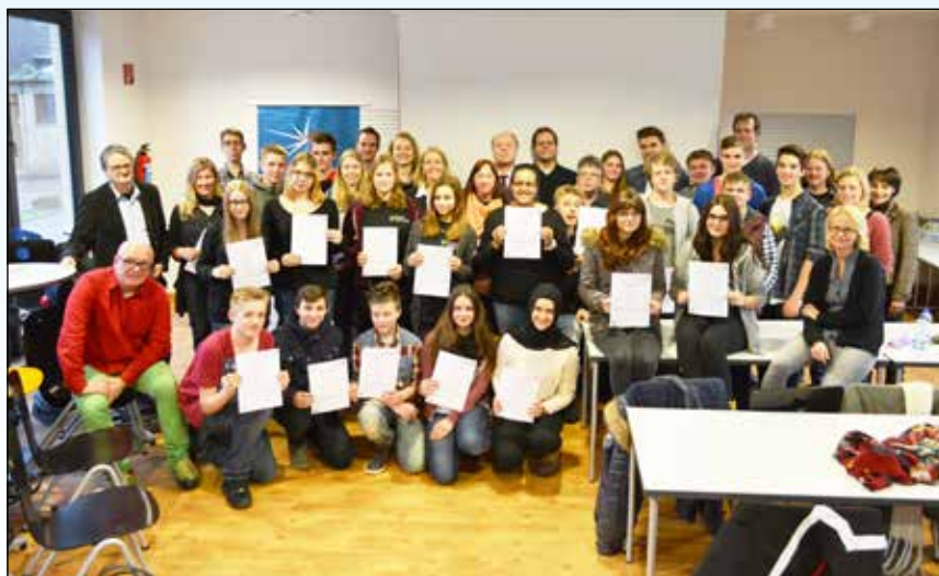
Zertifikatsübergabe am Gymnasium Freiherr-vom Stein Recklinghausen.

lassen. 15 Haupt-, Real- und Gesamtschulen sowie Gymnasien des Kreises (s.u.) hatten sich über das Regionale Bildungsbüro des Kreises Recklinghausen um eine Teilnahme am Mediencouts-Projekt der Landesanstalt für Medien Nordrhein-Westfalen (LfM) beworben und eine Zusage erhalten. In mehrtägigen Workshops an zentralen Orten im Kreis, dem Grimme-Institut in Marl und dem Freiherr-vom-Stein Gymnasium in Recklinghausen, wurden die auszubildenden Mediencouts und deren Beratungslehrpersonen zu den Themen Social Communities, Internetsicherheit, Cybermobbing, Computerspiele und Peer-Beratung qualifiziert. Aber nicht nur die eigene Medienkompetenz der Teilnehmenden stand im Fokus. Mediencouts geben ihr Wissen auch weiter: So können schuleigene Informations- und Beratungsangebote für Mitschülerinnen und Mitschüler (eventuell auch Eltern und Lehrer) entwickelt und durchgeführt werden, wie z.B. einzelne Unterrichtsstunden, Elternabende oder Projekttag zu Themen wie „Soziale Netzwerke“, „Cyber-Mobbing“, „Kostenfalle Handy“ oder „Computerspiele“. Eine Übersicht der Ergebnisse aus den Arbeitsgruppen und Bilder aus den Workshops als Präsentation erhalten Sie hier !