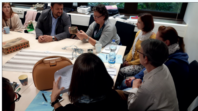
Gruppenarbeit mit Rätselkoffer

Nach einigem Ausprobieren von Lösungsansätzen und ausgiebigem Beratschlagen konnte das Team des Fachdienstes Bildung das Geheimnis lüften und die Geschichte um Tante Klothildes Erbe zu einem glücklichen Ende führen.