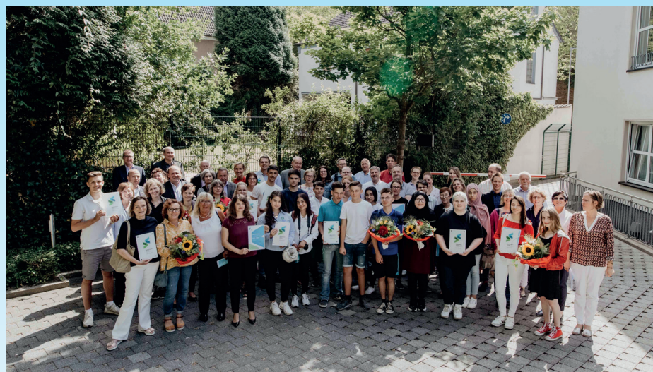
Gruppenbild mit Jury und Teilnehmenden Berufswahlsiegel 2019

Hochschulen, Verwaltung und weiteren Bildungsinstitutionen bewerten die Bewerbungen aus verschiedenen Perspektiven. Überzeugt das Konzept einer Schule, besuchen mehrere Jury-Mitglieder die Schule zu einem Audit, um vor Ort mit Schüler*innen, Lehrkräften und weiteren Partnern der Schule zu sprechen. Ist eine außerordentlich gute Studien- und Berufsorientierung beim Audit deutlich, wird der Schule das Berufswahl-SIEGEL für drei Jahre verliehen. Danach steht eine Rezertifizierung an. Wertgeschätzt wird das Engagement der (re-)zertifizierten Schulen ganz offiziell bei der jährlichen Feierstunde: In einem festlichen Rahmen nehmen Vertreter*innen