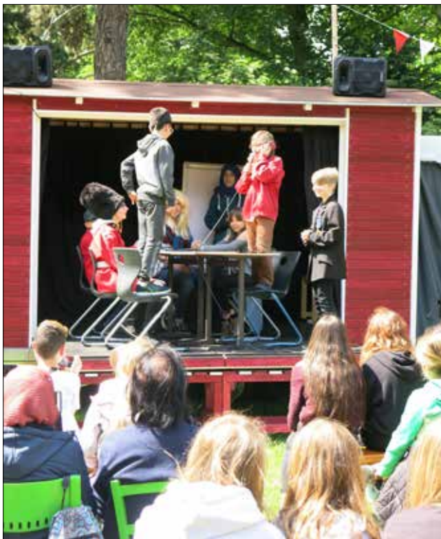
Präsidententreffen; Schüler*innen der Sekundarschule-Süd in Castrop-Rauxel

tung Mercator. Die eigenen persönlichen und sozialen Kompetenzen durch die kulturelle Bildung und erlebnisorientiertes Lernen zu stärken, ist das Ziel des Projekts, das sich an Schüler*innen der 5./6. Klassen in den Kohlerückzugsregionen richtet. Einblicke in diesen Prozess präsentierten die jungen Schausteller*innen, Performer*innen und Künstler*innen auf dem Jahrmarkt international.