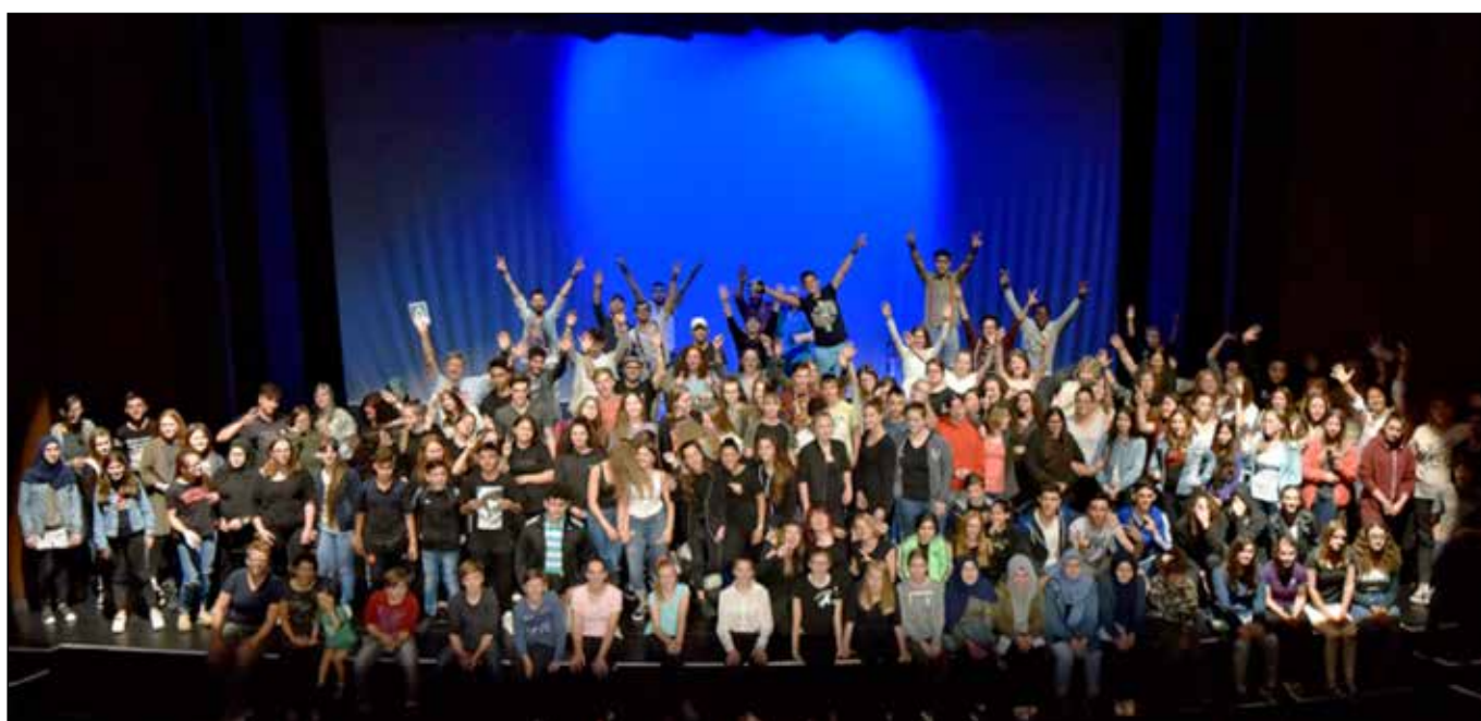
Teilnehmende bei den Schultheatertagen 2017

Ein Theaterfestival für alle Schulformen – das sind die Schultheatertage, die seit 2015 einmal im Jahr stattfinden. Im Theater Marl haben Schulen aller zehn Städte des Kreises die Möglichkeit, ihre Stücke auf einer großen Bühne zu präsentieren. Neben den Aufführungen gibt es ein buntes Rahmenprogramm, bei dem in Workshops professionelle Künstler*innen und Theaterpädagogen*innen Wissenswertes über die Arbeit am und im Theater vermitteln und Unterstützung für das Theaterspiel anbieten.