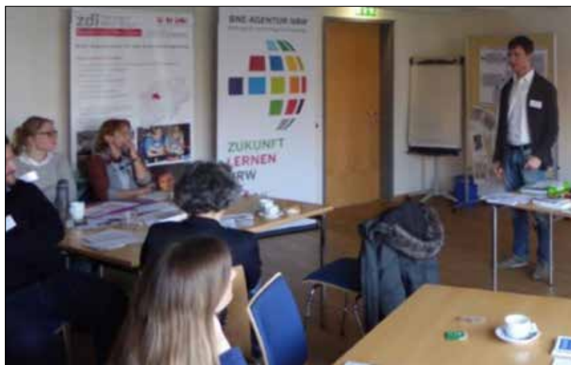
Workshop - BNE und zdi im Netzwerk Bildung

nahmen gewinnen. Klar wird während der Veranstaltung, dass die Planung und Durchführung der Umweltprojektwoche Ausdauer und Energie von Lehrerinnen und Lehrern verlangt und nur in Zusammenarbeit mit außerschulischen Partnern gelingt. Die kommunalen Bildungsbüros, initiieren und begleiten regionale Bildungsnetzwerke und unterstützen Schulen bei der Vernetzung mit außerschulischen Partnern. Fazit der Veranstaltung: die Umweltprojektwoche bereichert das Schulleben, fördert soziale und fachliche Kompetenzen der Schülerinnen und Schüler und – statt zu Jammern – werden sie motiviert, die Zukunft zu gestalten.