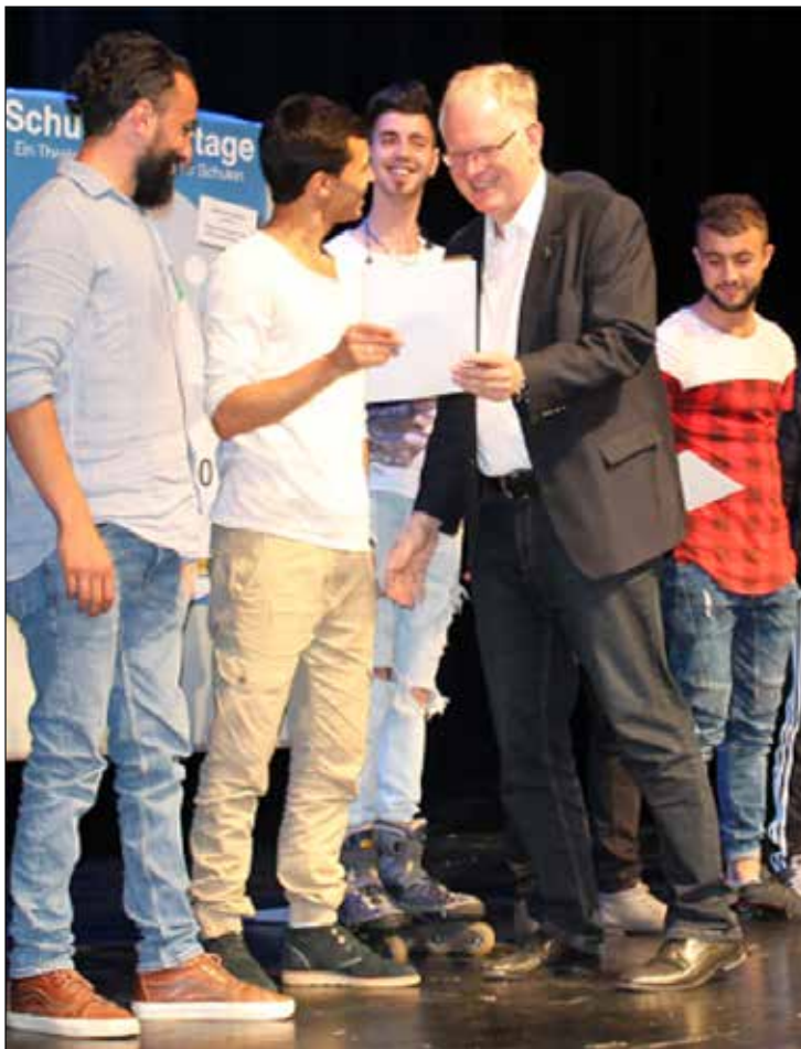
Landrat Cay Süberkrüb bei der Eröffnung der Schultheatertage 2017

Die „Vestische“ bietet einen kostenlosen Personentransport von den Schulen zum Theater Marl und zurück an. Interessierte Theatergruppen aller Schulformen können sich noch bis zu den Osterferien anmelden. Weitere Informationen und das Formular zur Anmeldung finden Sie unter folgendem Link 1 .