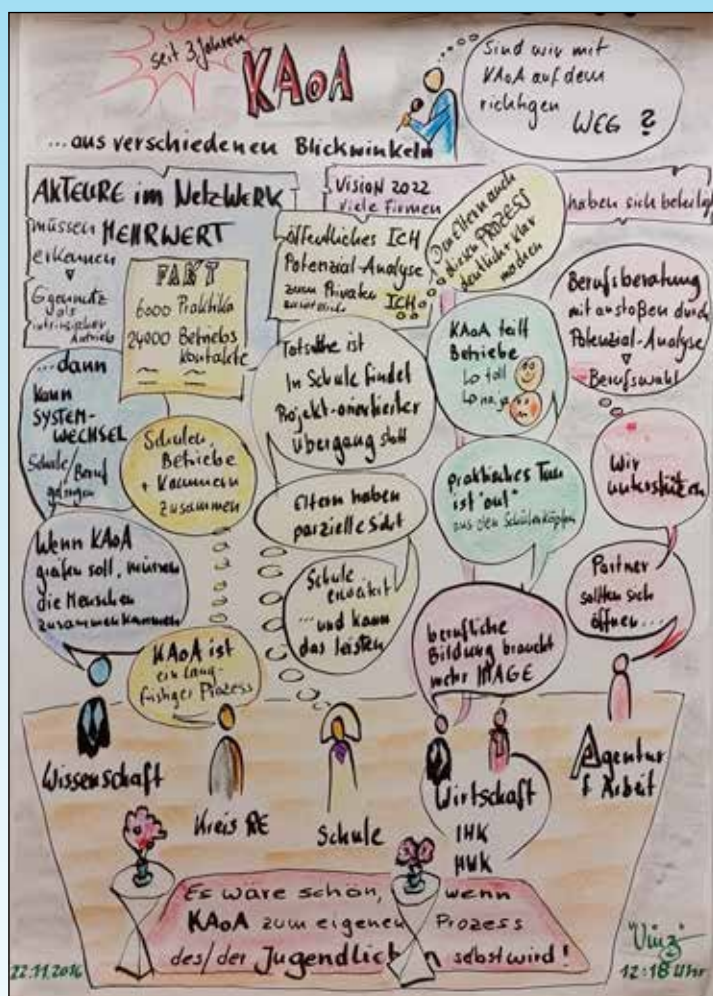
Illustrierte Protokoll der Podiumsdiskussion

Nach der Mittagspause, in der nochmals die Informationsstände auf dem Markt der Möglichkeiten besucht werden konnten, gingen die Teilnehmenden im Rahmen der 18 Workshops in den praktischen Austausch. KAOA-Neueinsteiger*innen kamen dabei ebenso auf ihre Kosten wie erfahrene KAOA-Partner*innen. In den Workshops wurde z.B. die Zusammenarbeit von Schulen und Betrieben thematisiert, Möglichkeiten zur Arbeit mit dem Berufswahlpass NRW als Portfolioinstrument vorgestellt und ein Überblick über die Situation des Ausbildungsmarktes im Kreis Recklinghausen gegeben. Außerdem stellten mehrere Schulen als Good Practice Beispiele ihre Arbeit in punkto Berufs- und Studienorientierung vor und verschiedene Schülergruppen sprachen mit den Teilnehmenden über ihre Wünsche und Bedarfe im Rahmen ihrer beruflichen Orientierung.