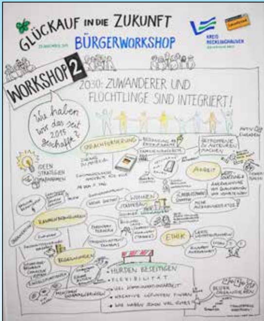
Vergrößerung auf Bildmitte klicken!

Methode Graphic Recording von Anja Weiss festgehalten.