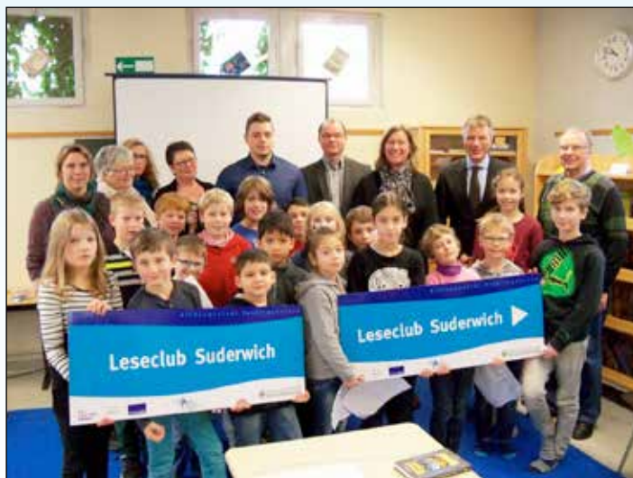
Der Leseclub in Suderwich, mit vielen Kindern, Erwachsenen und dem Bürgermeister

Die Stiftung Lesen entwickelt -wie der Name schon - immer wieder Leseprojekte, die sehr niederschwellig alle Bildungsschichten anspricht. 2011 ging das Projekt Lesestart an den Start, an dem sich die Stadt Recklinghausen selbstverständlich auch beteiligt. In diesem Projekt werden Lesepakete über Kinderärzte (2011 – 2013), Bibliotheken(2013 – 2015) und Grundschulen (2016 – 2018) ausgegeben. Die Ausbildung von Lesepaten findet schon seit vielen Jahren durch die Familienbildungsstätte in Recklinghausen statt und wird durch Mittel der Stiftung Lesen finanziert. Die ausgebildeten Lesepaten finden stadtweit in den Institution Kindergarten, Grundschule und offener Ganztage Einsatzmöglichkeiten.