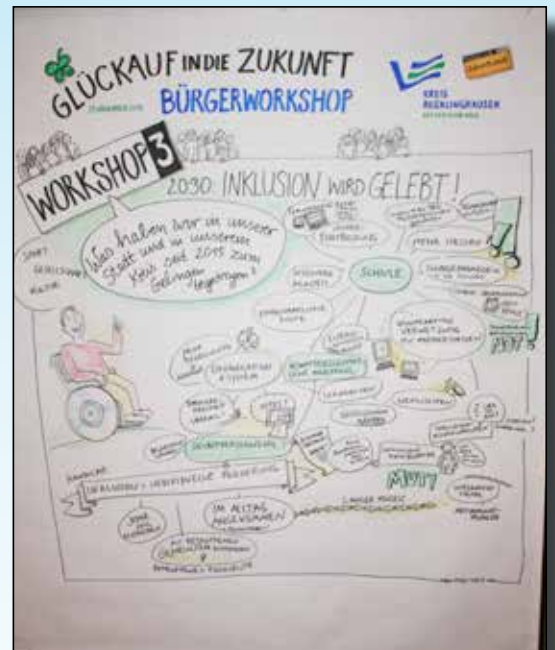
Vergrößerung auf Bildmitte klicken!

Bei der Bearbeitung aller drei Themen wurde sehr deutlich, dass große Schritte nötig sind, um das gedachte Ziel 2030 erreichen zu können. Der Bürgerworkshop ist Teil einer Veranstaltungsreihe, die der Kreis im Rahmen des Bundesprojektes „Zukunftsstadt“ entwickelt und durchführt. Themen wie Digitalisierung und Altenpflege/Pflegenotstand werden in Kürze starten. Mit den Ergebnissen wird sich der Kreis 2016 für die nächste Runde bewerben, denn dann werden noch 20 Zukunftsstädte/-kreise im Projekt weiter arbeiten.