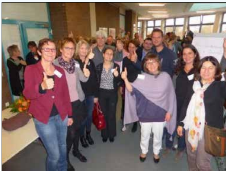
Ausschnitt der Ergebnispräsentation zur Fachtagung