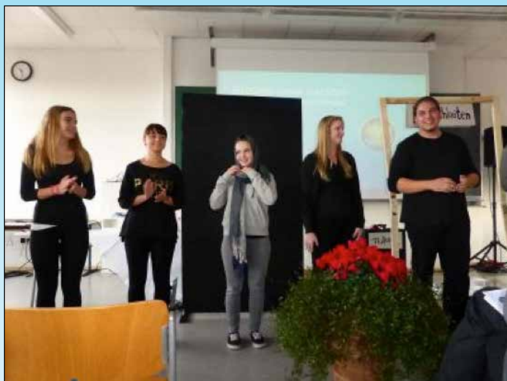
Theatergruppe des Dorstener Paul-Spiegel-Berufskollegs

die eine Entwicklung der kulturellen Vielfalt im Bildungssystem auslösen kann.