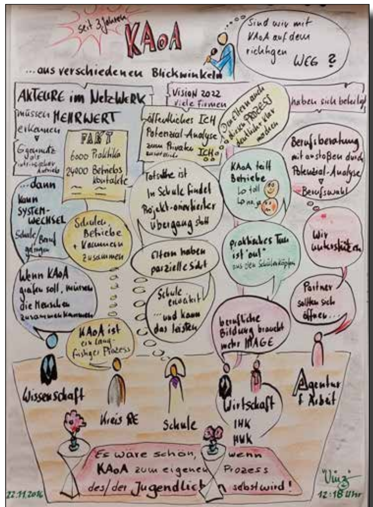
Illustrierte Protokoll der Podiumsdiskussion

Nach der Mittagspause, in der nochmals die Informationsstände auf dem Markt der Möglichkeiten besucht werden konnten, gingen die Teilnehmenden im Rahmen der 18 Workshops in den praktischen Austausch. KAOA-Neueinsteiger*innen kamen dabei ebenso auf ihre Kosten wie erfahrene KAOA-Partner*innen. In den Workshops wurde z.B. die Zusammenarbeit von Schulen und Betrieben thematisiert, Möglichkeiten zur Arbeit mit dem Berufswahlpass NRW als Portfolioinstrument vorgestellt und ein Überblick über die Situation des Ausbildungsmarktes im Kreis Recklinghausen gegeben. Außerdem stellten mehrere Schulen als Good Practice Beispiele ihre Arbeit in punkto Berufs- und Studienorientierung vor und verschiedene Schülergruppen sprachen mit den Teilnehmenden über ihre Wünsche und Bedarfe im Rahmen ihrer beruflichen Orientierung.