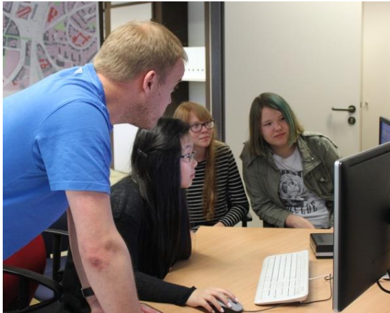
Erstellen einer Flurkarte im Bürgerservice